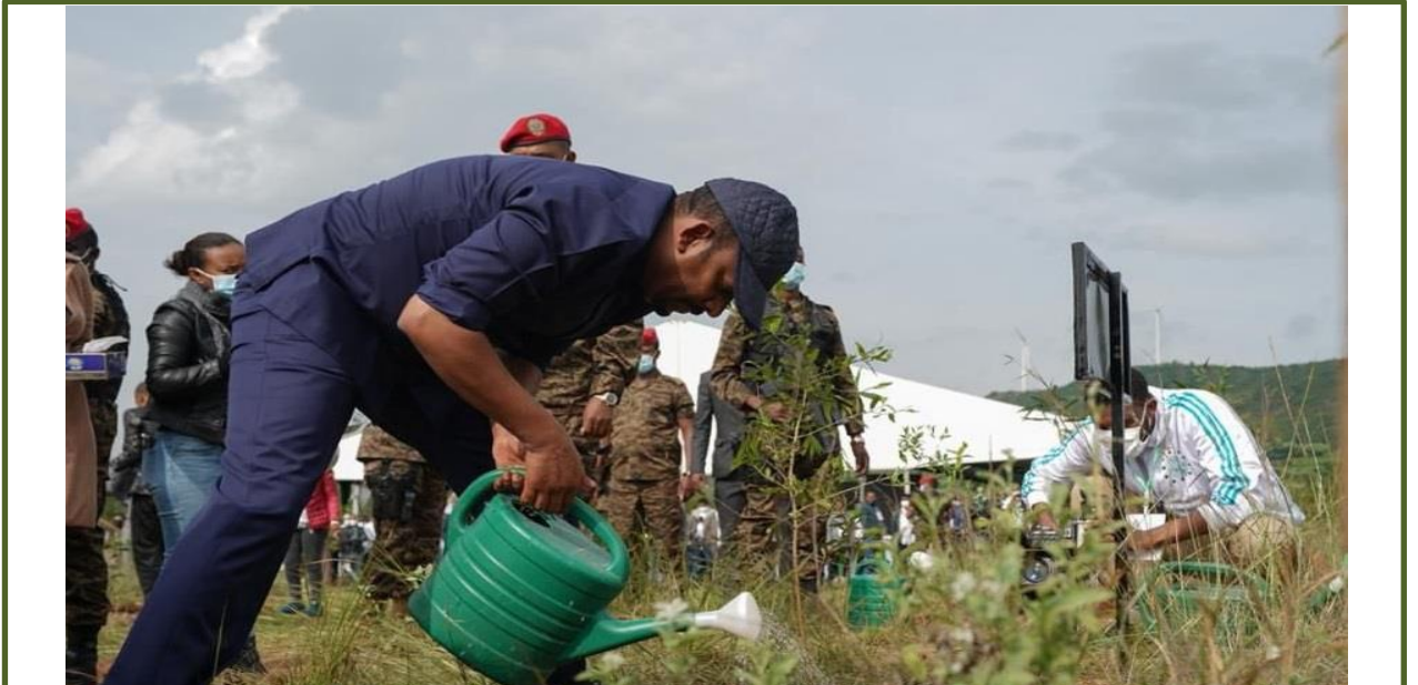
ክቡር ጠቅላይ ሚኒስትር ዶ/ር ዐብይ አህመድ ለመላው ኢትዮጵያውያን 6.7 ቢሊዮን ችግኞችን በመትከል የተከለው ወቅት በስኬት ስለተጠናቀቀ የእንኳን ደስ አላችሁ መልእክት አስተላልፏል

ኤን.ዲ.ሲ. ሀይላይትስ በሚል ርዕስ በየሁለት ወፍ በአካባቢ፣ ደንና አየር ንብረት ለውጥ ከሚሸን እየተዘጋጀች የምትሰራጩው ይህኛ ዜና መፅሄት የኢትዮጵያን በፈቃደኛነት ላይ የተመሰረተ የአየር ንብረት ለውጥ ተፅዕኖ ለመቀነስ የተዘጋጀውን ዕቅድና አፈፃፀሙን በተመለከተ መረጃዎችንና አዳዲስ እውቀቶችን ለተለያዩ ባለድርሻዎች የማድረስ ዓላማ አላት።